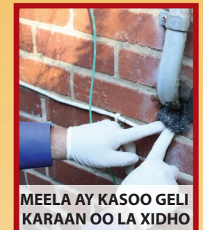
MEELA AY KASOO GELI KARAAN OO LA XIDHO