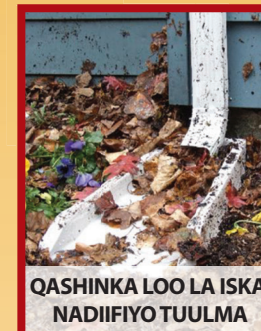
QASHINKA LOO LA ISKA NADIIFIYO TUULMA