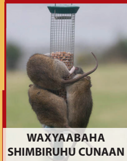
WAXYAABAHA SHIMBIRUHU CUNAAN