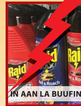
IN AAN LA BUUFIN