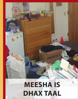
MEESHA IS DHAX TAAL