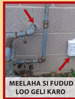
MEELAHA SI FUDUD LOO GELI KARO