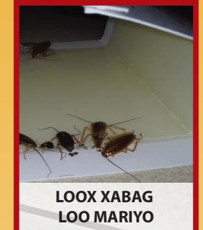
LOOX XABAG LOO MARIYO